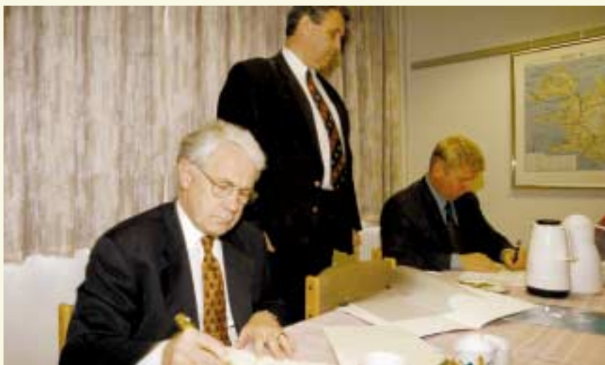
Samstarfsyfirlýsingin undirrituð af ráðherra umhverfismála, Guðmundi Bjarnasyni, og Finni Ingólfssyni, iðnaðarráðherra 2. október sl.

Samstarfsyfirlýsing á milli Landmælinga Íslands og Orkustofnunar um landmælingar og kortagerð var undirrituð sl. haust. Með samningnum takast Landmælingar Íslands á hendur það hlutverk á sviði landmælinga sem Orkustofnun hefur sinnt um árabíl. Jafnframt taka þær við miklu gagnasafni á sviði landmælinga sem þar hefur verið byggt upp.